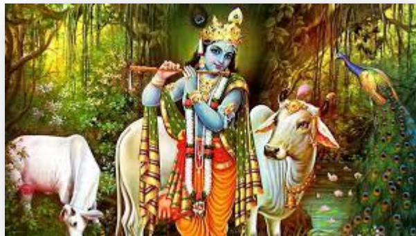
Priljubljeni hindujski bog Krišna.

Simbol hinduizma je „om“ ali „aum“, ki predstavlja najsvetejši glas.