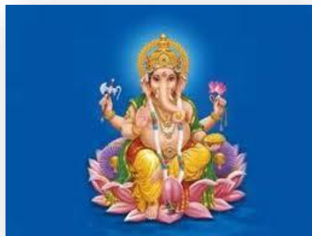
Ganeš – bog premagovanja ovir in modrosti