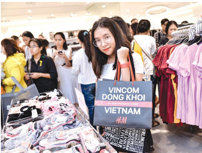
SLIKA 2: Najstniki v Vietnamu nosijo enake znamke oblačil, kot tisti v Evropi – na sliki gneča v trgovini H&M.

Spodaj: Delavke v tovarni H&M v Bangladešu.