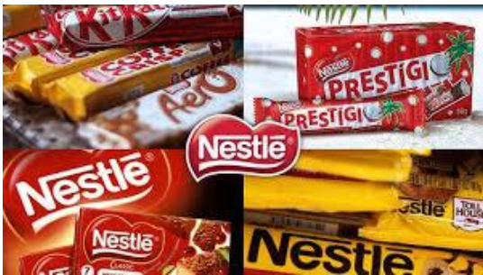
SLIKA 1: Nestlé je multinacionalno prehrabeno podjetje, ki ima svoje tovarne in trgovine skoraj po vseh državah sveta. Ukvarja se tudi z prodajo ustekleničene vode, ki jo črpa iz vodnih virov različnih držav, nato pa prodaja po celem svetu. Nedavno je odmeval primer črpanja vode v francoskem mestu Vittel, kjer se je količina vode v podtalnici po črpanju skokovito znižala, zato so Nestlé prisilili, da je zmanjšalo obseg črpanja.

V učbeniku na str. 70 preberi, kako se globalizacija odraža na gospodarskem, političnem in kulturnem področju . Na spletu poišči tri fotografije , ki prikazujejo dogajanje v zvezi z globalizacijo. Pod vsako zapiši stavek ali dva, kaj fotografija prikazuje. Pripravila sem nekaj primerov, da si boste lahko predstavljali, kako morate narediti